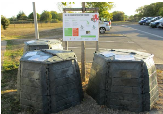
Résidence rue du Haut-Rillon, Châtelaillon