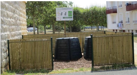
Quartier de Port-Neuf (OPH), La Rochelle