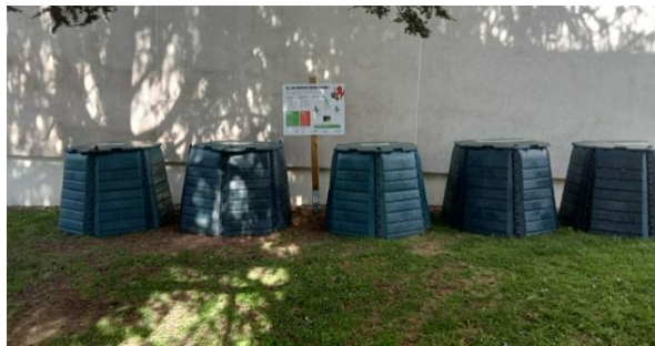
Résidence rue Giraudoux, La Rochelle