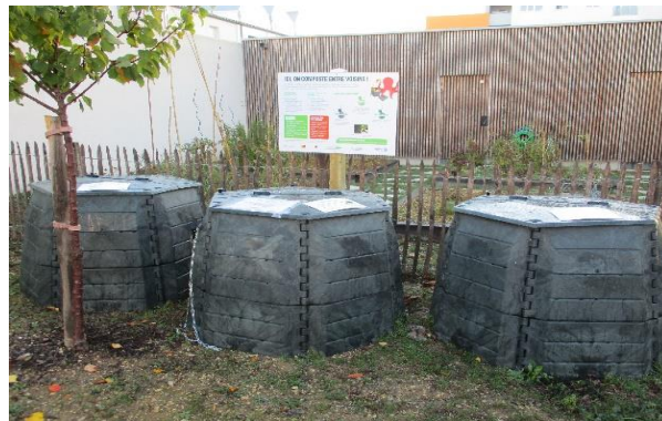
Résidence rue André Malraux, La Rochelle