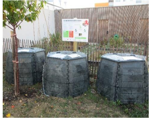
Résidence rue André Malraux, La Rochelle

Dans le cadre de la loi anti-gaspillage pour une économie circulaire (AGEC) adoptée en 2020, et l'entrée en vigueur de l'obligation de tri à la source des biodéchets au 1er janvier 2024, la Communauté d'Agglomération de La Rochelle propose un accompagnement à l'installation de sites de compostage partagé en habitat collectif (résidence ou immeuble implantés sur le territoire de la Communauté d'Agglomération de La Rochelle).